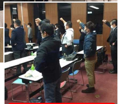
連合集会 (鹿児島中央支部)