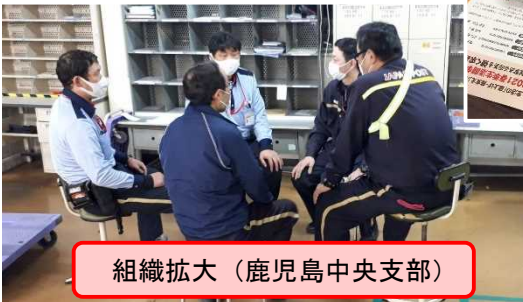
組織拡大 (鹿児島中央支部)