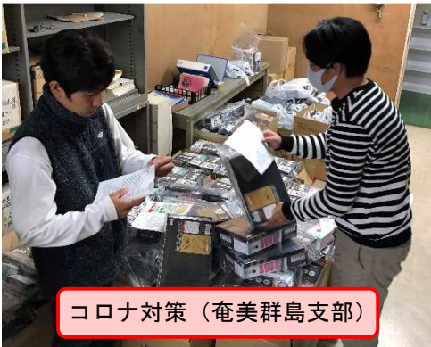
コロナ対策 (奄美群島支部)