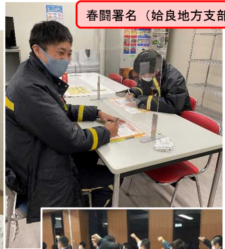
春闘署名 (始良地方支部)