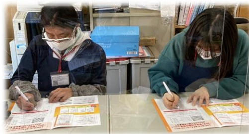
南関東:横浜鶴見支部