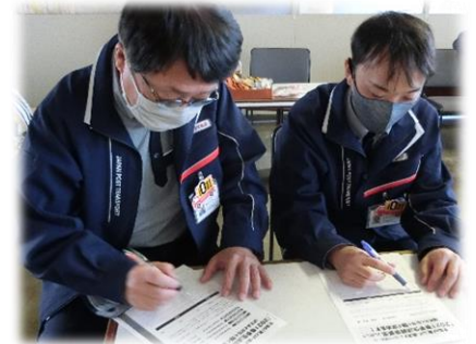
東海:東海郵便輸送支部