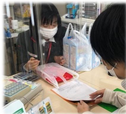
北陸:富山名水の里支部

21春闘へ向けた想いを一言 ボーナスは必ず子どもの学費が困ります。 なので維持して下さい!