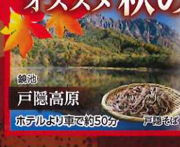
鏡池 戸隠高原 ホテルより車で約50分 戸隠地区