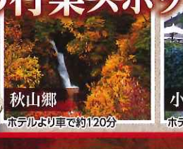
秋山郷 ホテルより車で約120分