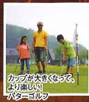
カップが大きくなって、 より楽しい パターゴルフ

※バイキングパックは適用除外日がございます。 ※上記料金は消費税・サービス料込み、入湯税が別途150円(12才以上)がかかります。 ※バイキング休業日には、コースレストランに対応させていただきます。