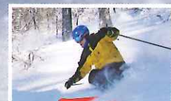
極上のパウダースノー! ツリーランコース

※12/29~1/2と1/3~3/31の金・土・日は特定期間となりますのでご予約方法が一部異なります。