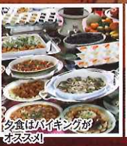
夕食はバイキングが オススメ!