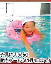
子供に大人気! 室内プール(11月4日まで)