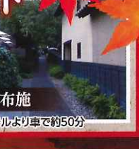
小布施 ホテルより車で約50分