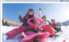
ママもパパも安心の キッズパーク