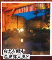
疲れを癒す 温泉露天風呂