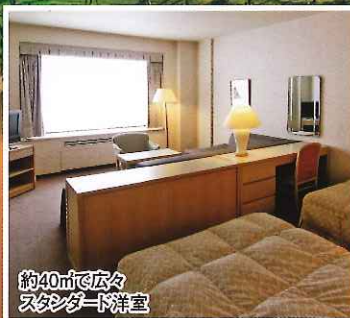
約40㎡で広々 スタンダード洋室