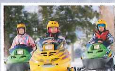
5才から1人で乗れる スノーモビル