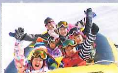
モバイルで引っ張る スノーラフティング