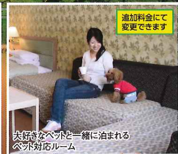
追加料金にて 変更できます